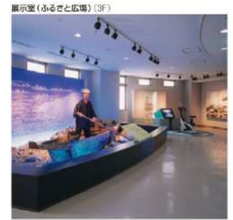
展示室(ふるさと広場)(3F)

展望タワーには各種のトレーニング機器を設置したヘルスルームや、施設利用者のだんらんの場として娛樂室を設けました。