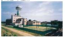
テニスコート(屋外)