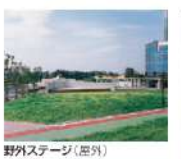
野外ステージ(屋外)