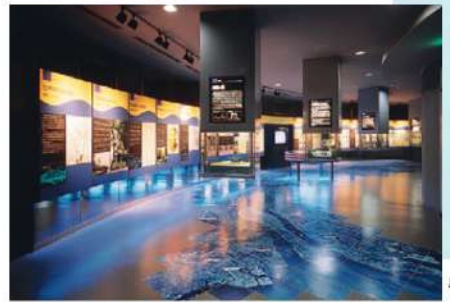
展示室(2F) (木曾川物語)