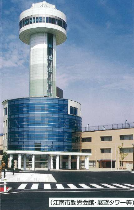
(江南市勤労会館・展望タワー等)

〒463-8007 江南市平井町西200番地 木曽川架橋大橋下流約800m、名岐大1線江南駅より約5km 駐車場：乗用車約360台、観光バス3台 (一般用) 0587-53-5111 (FAX) 0587-53-5000 (レストラン) 0587-53-5353 ホームページアドレス http://suito pia.jp/ 予約用 0587-53-5555