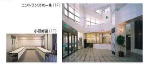
エントランスホール(1F)