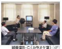
娯楽室B・C(カラオケ室)(4F)