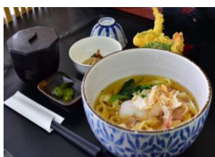
天婦羅きしめん定食