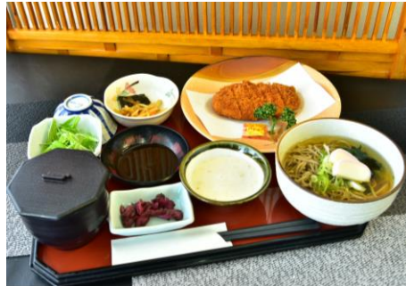
夢とろろカツ定食