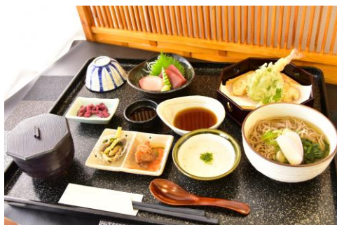
夢とろろ自然薯御膳