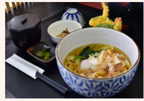
天婦羅きしめん定食