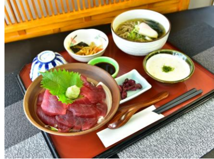
夢とろろ鉄火丼セット